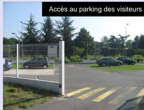
Accès au parking des visiteurs

«Les trajets de tous les jours sont dangereux tous les jours». Le Département de l'Essonne vous incite à la prudence au volant. Lorsque cela est possible, préférer les transports en commun.