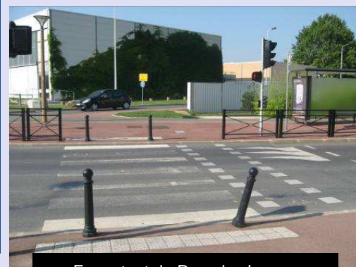
En sortant du Parc des Loges, traversez le boulevard de l'Ecoute-s'il-pleut et dirigez vous à droite