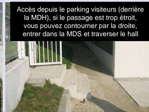
Accès depuis le parking visiteurs (derrière la MDH), si le passage est trop étroit, vous pouvez contourner par la droite, entrer dans la MDS et traverser le hall