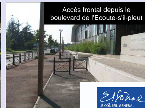
Accès frontal depuis le boulevard de l'Écoute-s'il-pleut