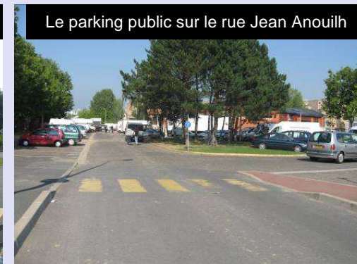
Le parking public sur le rue Jean Anouilh