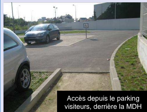
Accès depuis le parking visiteurs, derrière la MDH

Lorsque vous descendez à l'arrêt «Parc des Loges», vous devez traverser le parc pour rejoindre la Maison Départementale de l'Habitat (le l'autre côté du terrain de football - reportez-vous sur le plan pour mieux vous situer). Vous débouchez alors sur le boulevard de l'écoute s'il pleut, traversez, la Maison Départementale de l'Habitat se trouve légèrement sur votre droite.