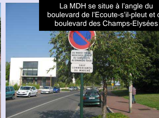
La MDH se situe à l'angle du boulevard de l'Ecoute-s'il-pleut et du boulevard des Champs-Élysées