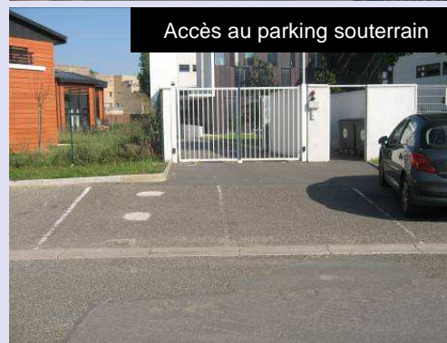
Accès au parking souterrain